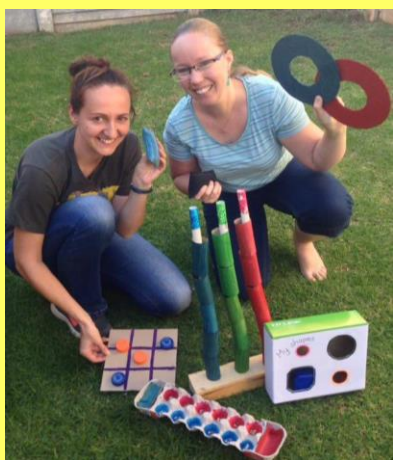
S mou novou šéfovou