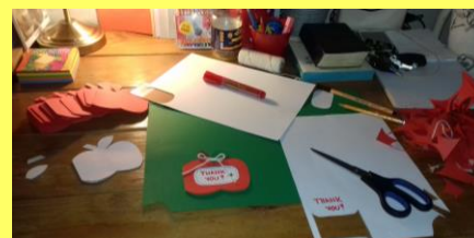
Příprava rozloučení, kartiček pro děti v odpolední škole