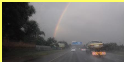
No nevyfoťte tu krásu ;-)