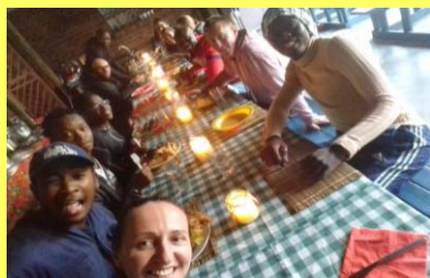
Rozlučková večeře v Meetse