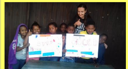
S dětmi z pátečního biblického klubu

Pokračuji pilně se svým studiem, jehož součástí je pravidelný dětský klub v pátky, pomáhám stále na sobotním dětském klubu v Meetse a vyučuji ve škole ve středy. Mimo jiné budeme připravovat brožurku s nápady pro službu dětem.