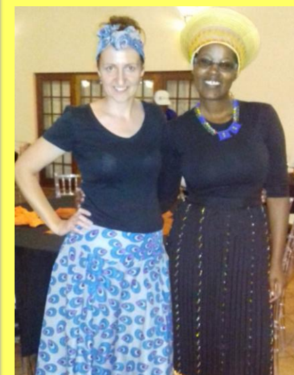
V africkém stylu