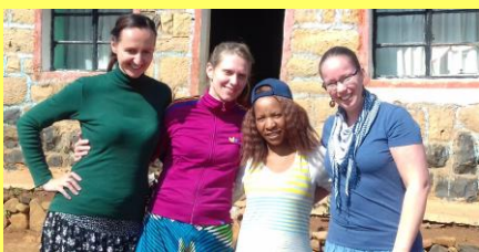
S mým týmem v Lesothu