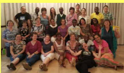
Týdenní školení-studenti online kurzu, který studuji