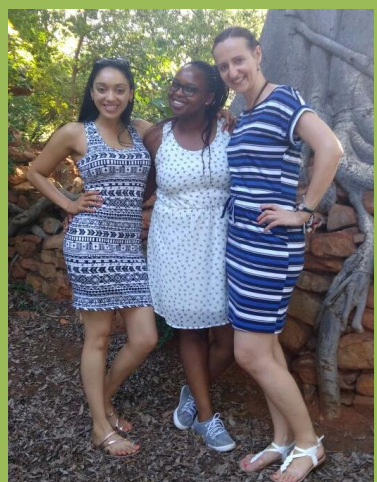
Rozlučka s mými spolubydlícími