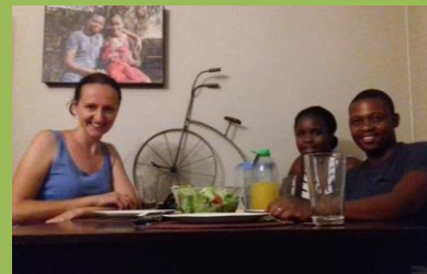
Večere s přáteli