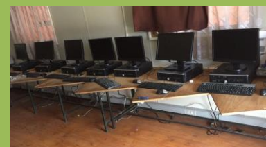
Dar z holandska - pro naši počítačovou učebnu