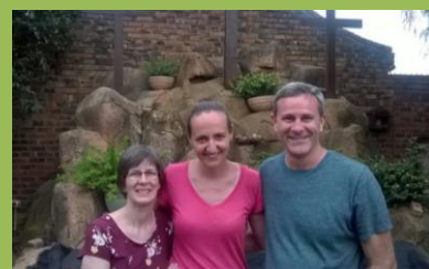
Vzácná návštěva - noví ředitelé OM Česká Republika