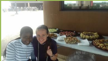
Pomoc kamarádce s pečením