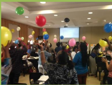
Školení pracovníků s dětmi