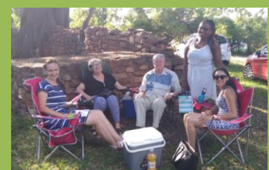
Rozlučka se spolubydlícími