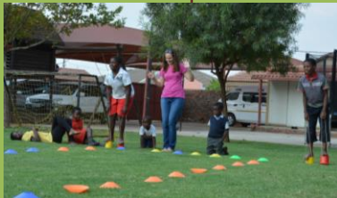
Hry v odpolední škole