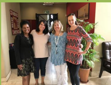
Setkání s přáteli