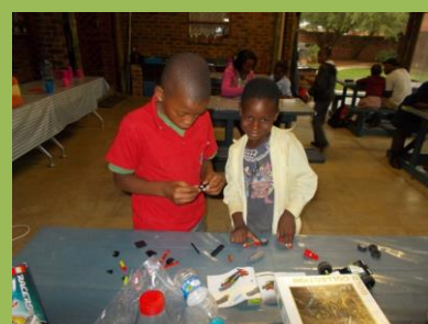
Děti si hrají s legem

We wszystkim tym, co zdrarza się w życiu człowieka, trzeba odczytać ślady miłości Boga. Wtedy do serca wkroczy radość.