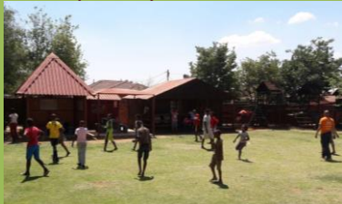
Hry v odpolední škole