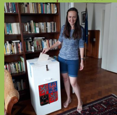
Volby na české ambasádě v Pretorii