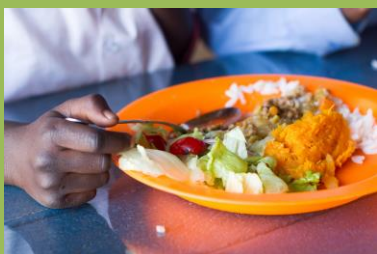
Každodenní výživově hodnotný oběd z darovaných potravin