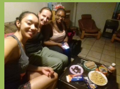
Ochutnávka dobrůtek z domova