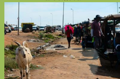
Tržiště v Mamelodi