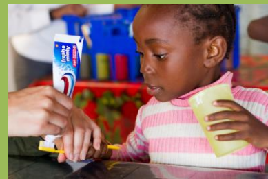
Po dobrém obědě si čistíme zuby a dostáváme vitamíny

Nyní jen stručně, po Velikonocích začnu pomáhat s přípravou učitelů právě tam. Je to stále v OM a v Pretorii. Budu stále částečně zapojena do služby v Mamelodi - v AIDS Hope. Více podrobností v příštím zpravodaji.