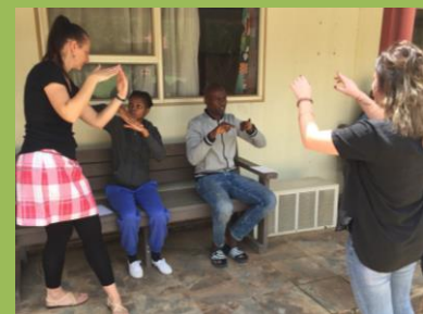
Team-buildingové aktivity na začátku roku