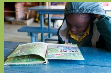
Čtení v odpolední škole