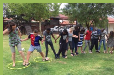
Team-buildingové aktivity na začátku roku