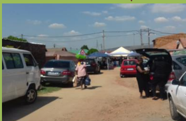
Pohřeb, svatba, party- zastavena ulice-běžná praxe