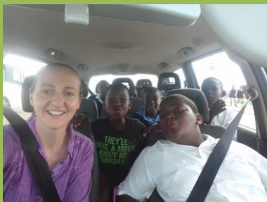
Každodenní vyzvedávání dětí ze vzdálenějších škol