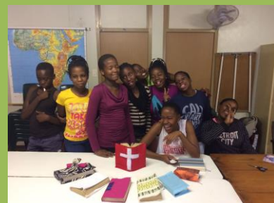
Vyrábění obalů na bible na našem dívčím dorostu