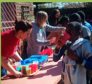
Rozdávání džusu na dětském klubu