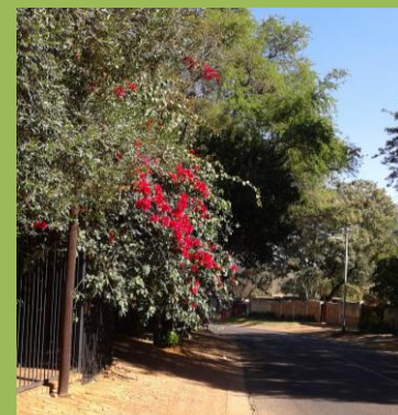
Na procházce do obchodu aneb rozkvetlá africká zima

Dzieci potrzebują bardziej dobrego przykładu niż krytyki. J.Joubert