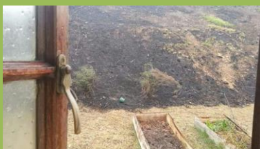
Pohled z pokoje dívky modlící se za ochranu jejich domu