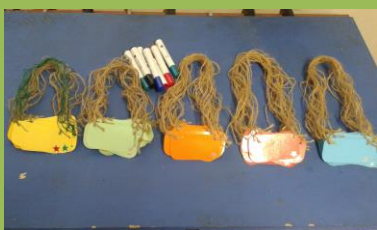
Jmenovky připravené k použití na dětský klub