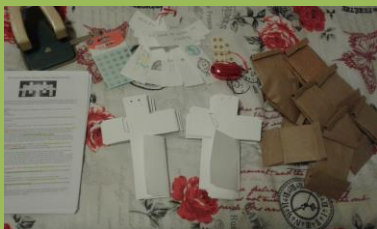
Přípravy do malých skupinek na velikonoční klub