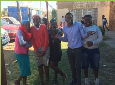
Některé z našich dětí začaly navštěvovat jeden z místních partnerských sborů