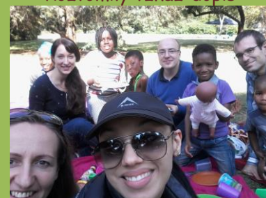
Velikonoční neděle a piknik v místní botanické zahradě