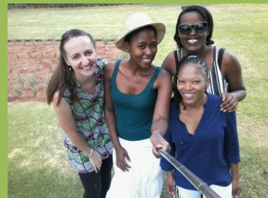
Narozeninový piknik v parku