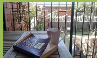
Nedělní odpoledne s kávou, knížkou a výhledem do naší malé zahrádky