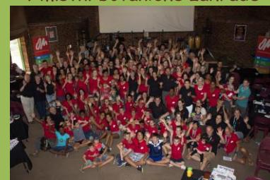
Kdo mne najde?