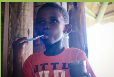
Učíme děti i základním hygienickým návykům