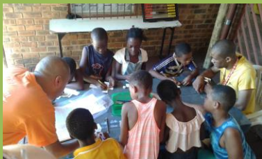
Jedna skupinka s vyučujícími dobrovolníky z TeenChallenge