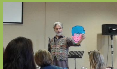
Cartoon workshop aneb jak si namalovat vyučovací pomůcky

Pokud Ti Bůh klade na srdce jednu nebo druhou možnost finanční podpory, napiš mi prosím email. Předem velice děkuji!!!