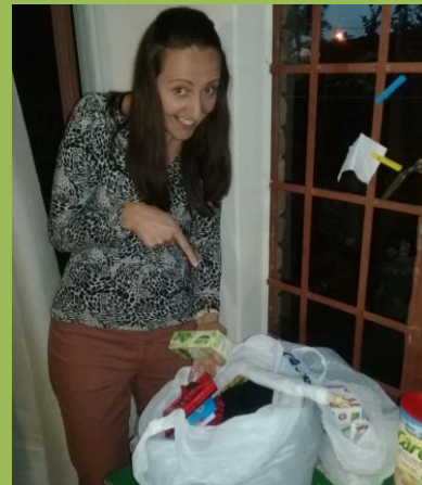
Nadšení z dárečků z domova