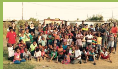
Děti slouží dětem

Na konci června plánujeme podobnou akci v parku poblíž, kde budeme mít různé soutěže a naše děti se budou znovu sdílet se svou vírou.